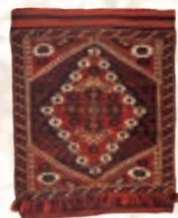
ベルガマ アナトリア西部 20世紀中期