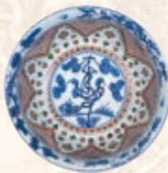
金欄手寿文大鉢 明時代