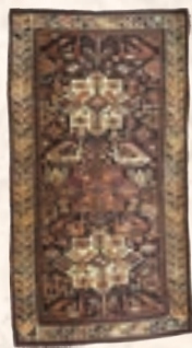
アクスタファ コーカサス 19世紀中期