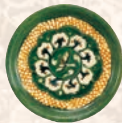
唐三彩荷葉飛雁文盤 唐時代