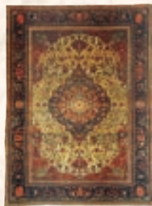
モフトファム カシヤン ペルシヤ中央部 20世紀初期