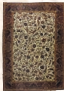
イスファハーン ペルシヤ中央部 シュレシ工房 20世紀中期