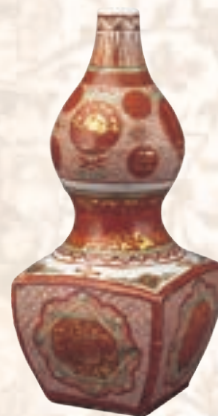
金欄手瓢形瓶 明時代